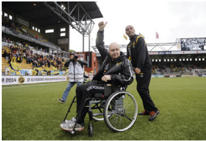
Elfsborgs tränare Klas Ingesson tillbaka, efter operationer av brutet ben, inför söndagens allsvenska fotbollsmatch mellan IF Elfsborg och IF Brommapojkarna på Borås Arena i Borås.