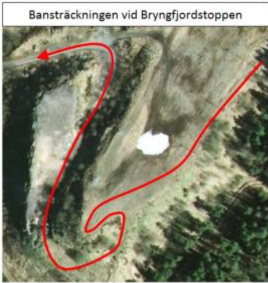
Banan vid bryngfjordstoppen ur annan vinkel